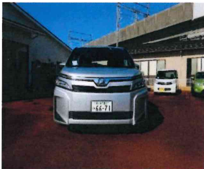
トヨタ ノア 前面