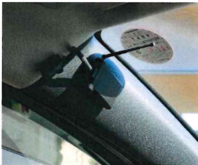
人感感知センサー